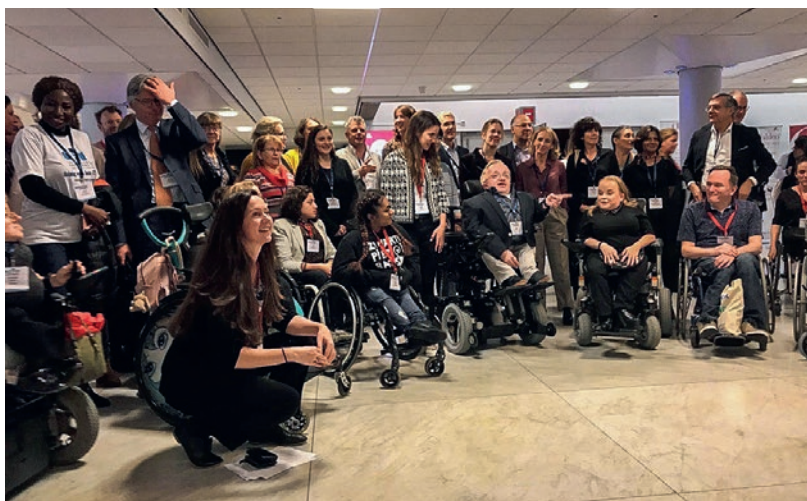
Parmi les 300 participants se trouvaient des patients OI de tous âges et avec des formes très différentes d'atteintes du tissu conjonctif.

Pour plus d'informations sur l'ostéogénèse imparfaite, rendez-vous sur www.glasknochen.ch