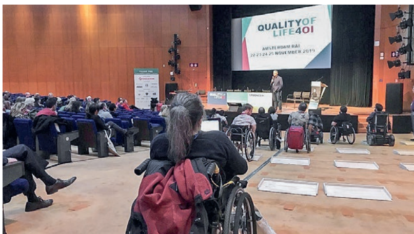
Grâce aux aménagements provisoires, la salle de conférence a été rendue particulièrement confortable pour les participants.